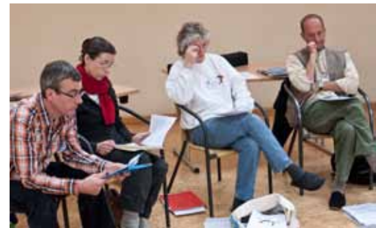
Moderation: Kerstin Kraft